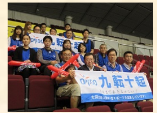
【ゴールボール応援観戦】