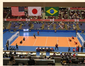
【ゴールボール競技】