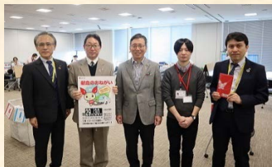
大同生命の森中専務と日赤担当者 CSR推進課の皆さん