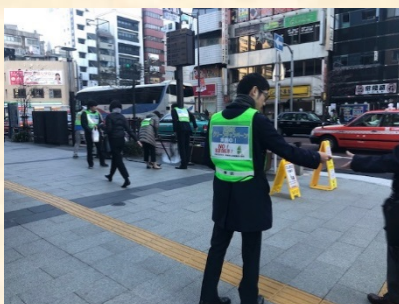
みなとタバコルールのティッシュ配布