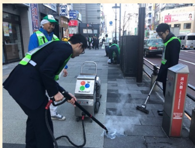
ガム痕除去作業の様子

T&Dフィナンシャル生命は、12月12日(木)に浜松町駅北口付近で実施された、「芝地区クリーンキャンペーン～路上喫煙ゼロのまち！～」に参加し、ガム痕除去等の清掃活動や路上喫煙禁止の啓発活動に取り組みました。ガム痕除去は専門スタッフの指導の下、専用の機械を使用して除去します。また、啓発活動では歩行者に「みなとタバコルール」の啓発ティッシュを配布し、歩行喫煙・路上喫煙・タバコのポイ捨て禁止を呼びかけました。T&Dフィナンシャル生命は、これからも地域の一員として積極的に社会貢献活動に取り組んでいきます。