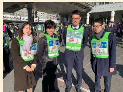
参加されたTDF生命の皆さん